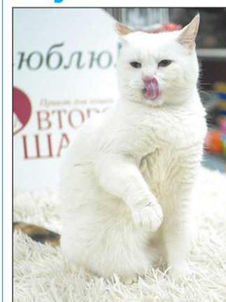
Белоснежная кошечка Маша в поиске дома. Ей 5 лет, она привита и стерилизована.

Наша редакция и приют «Второй шанс» продолжают специальную рубрику. Вдруг среди опубликованных четвероногих обитателей приюта вы найдете свое счастье.